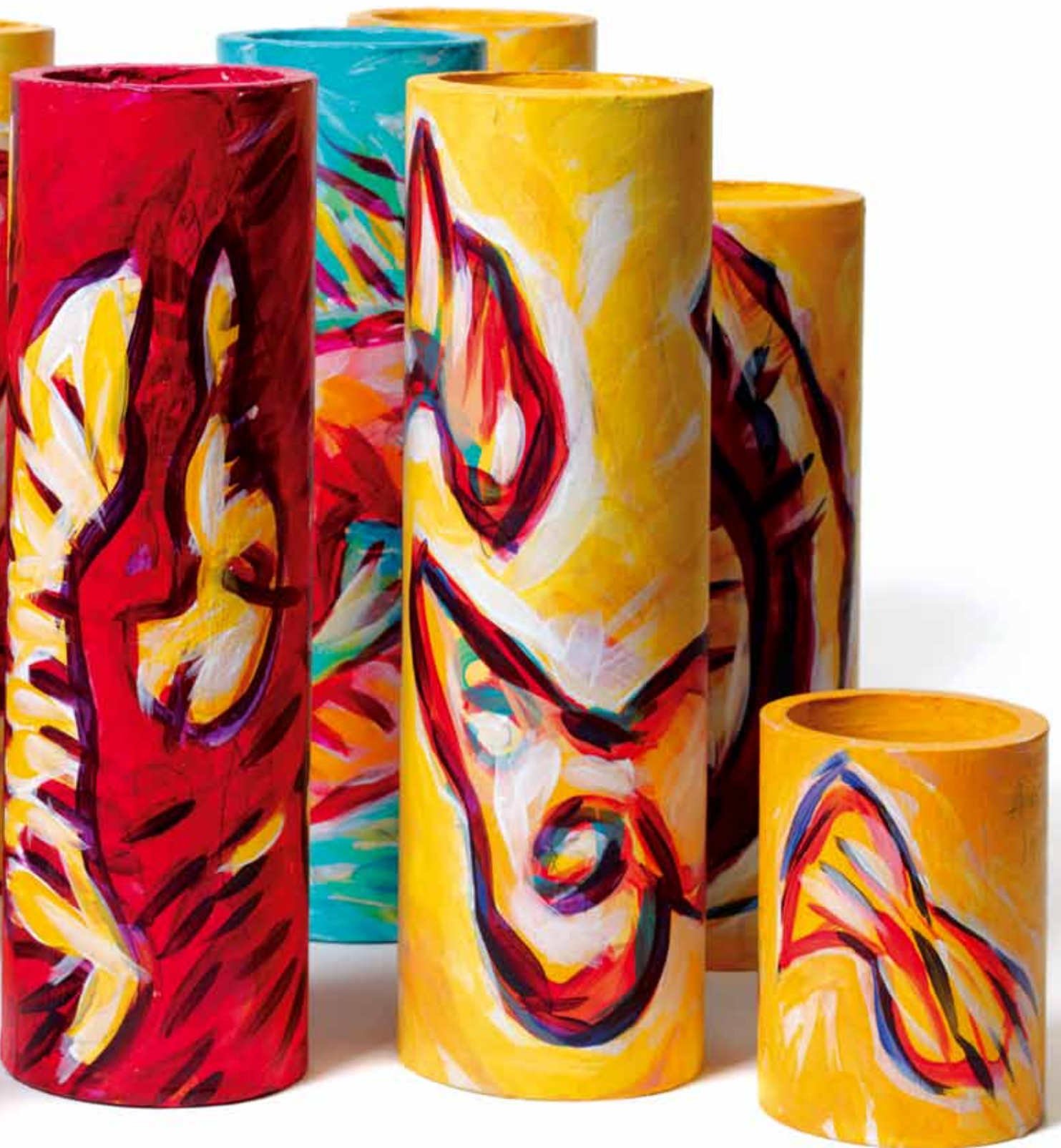
Eine Herde ganz junger Orgon-Akkumulatoren flockt sich eng zusammen, 2008, Bleistift, Schrift, Acryl auf Kartonröhren, Höhe 9 bis 31 cm