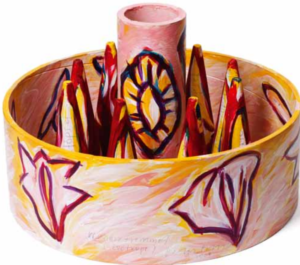
Wundertrommel (Zoëtrope) mit 8 Analstöpseln und 1 Königin, 2008, Bleistift, Schrift, Acryl auf Kartonröhren, Holzscheibe, 40 x 29 cm