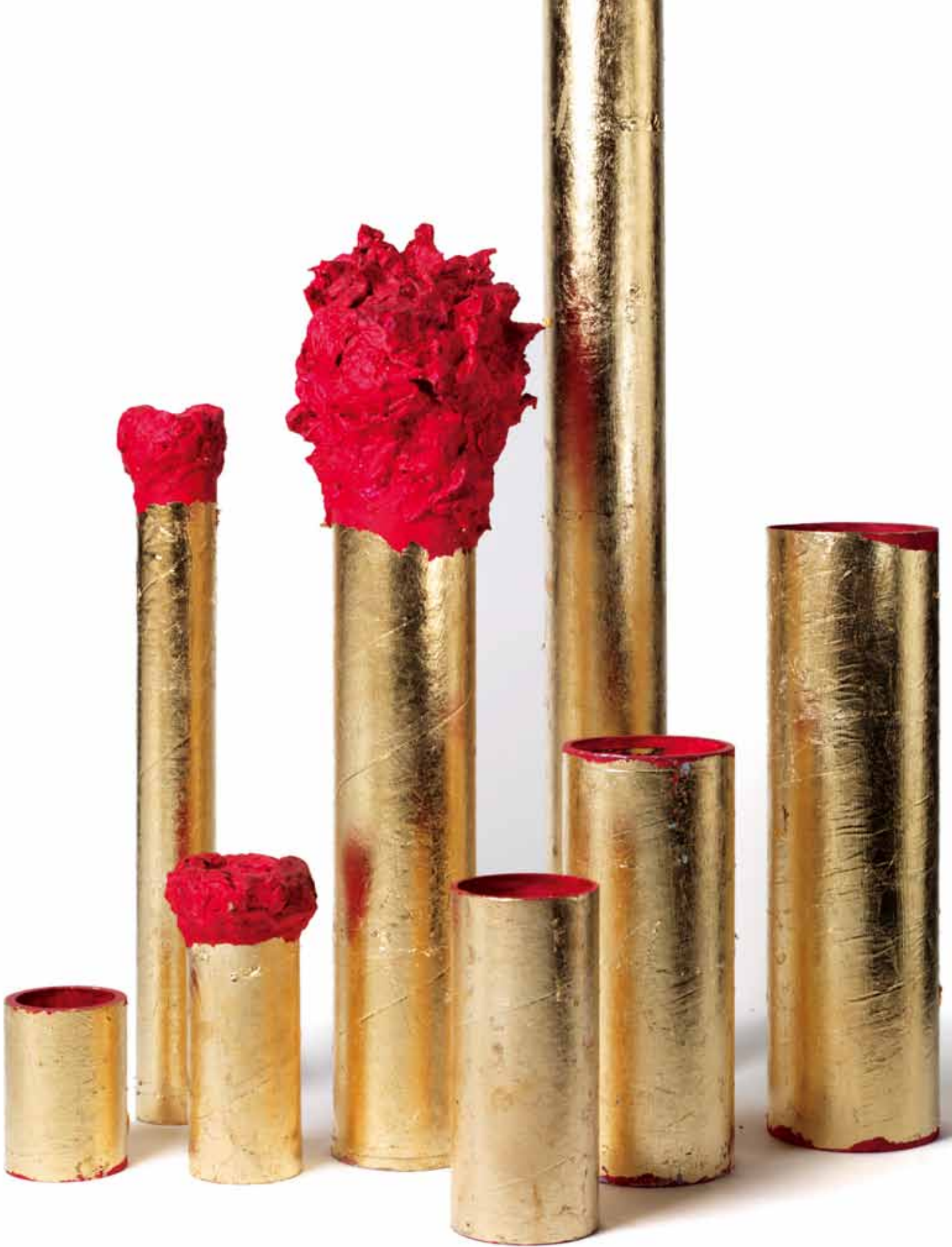
Der König und einige seiner engsten Vertrauten, 2008, Schlagmetall, Papiermaché, Acryl auf Kartonröhren, Höhe 10 bis 90 cm